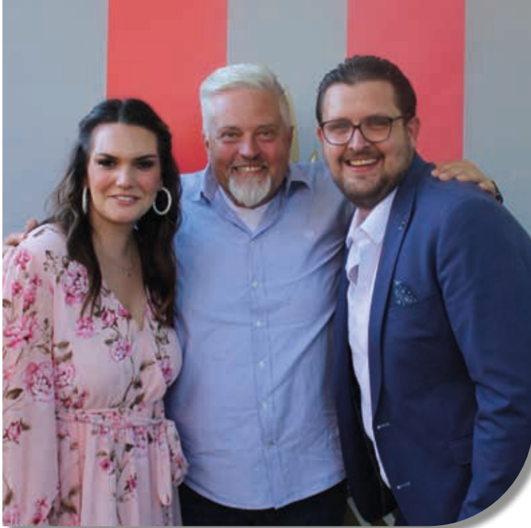
Der Adjutant macht sich schon mal mit dem künftigen Prinzenpaar vertraut.

Da er bei der Jahreshauptversammlung der Garde nicht anwesend sein konnte, wünschte er den Wiedergewählten viel Glück und dass sie die Verantwortung für die Garde übernommen haben. Außerdem wies er noch darauf hin, dass die Prinzengarde eine großartige Garde der Stadt sei.