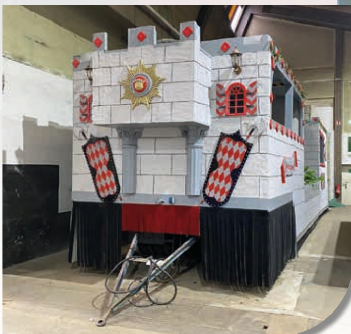
Und das ist das tolle Resultat von vielen Stunden Arbeit, Engagement und Fleiß