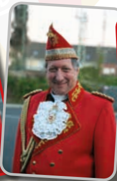
Casino Rainer Böhm