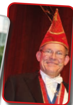
Präsident Frank Kindervatter